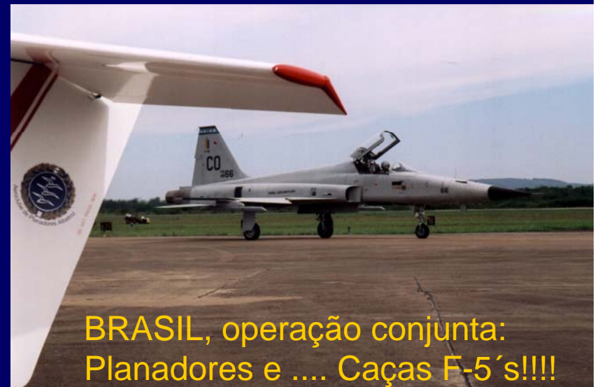
BRASIL, operação conjunta: Planadores e .... Caças F-5's!!!!