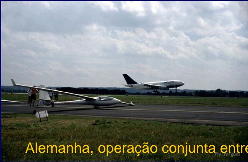
Alemanha, operação conjunta entre planadores e ...Boeing's 737!!!