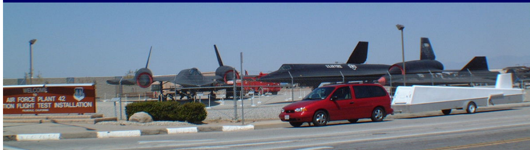
USA, operação conjunta: planadores e SR71???